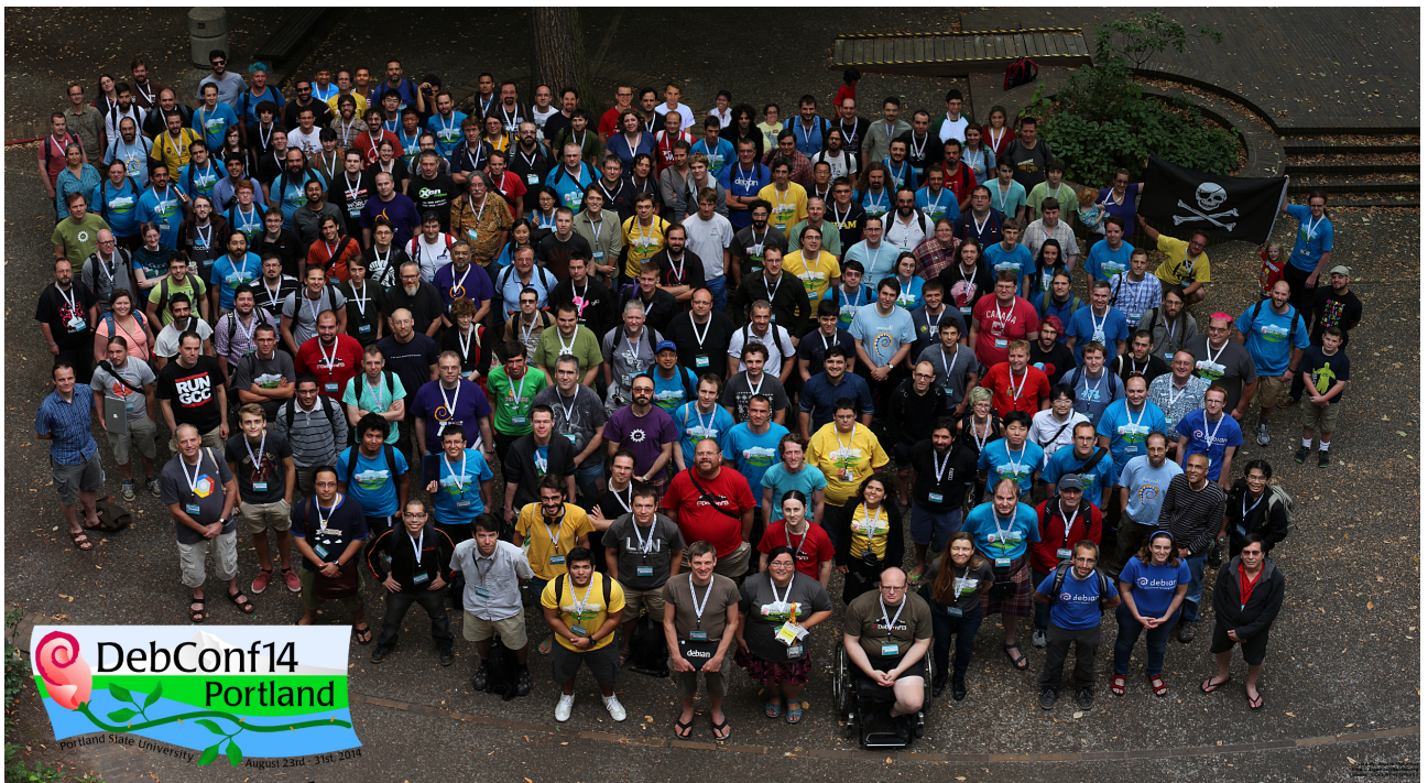
Teilnehmer der DebConf14 in Portland, Oregon (USA)